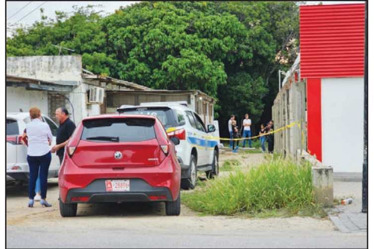
Dokter cu a presenta na e sitio no por a constata nada abnormal ariba e curpa; y ta constata cu e persona a muri un morto natural.

E persona posiblemente tawata tin algun dia cu e la fayece.