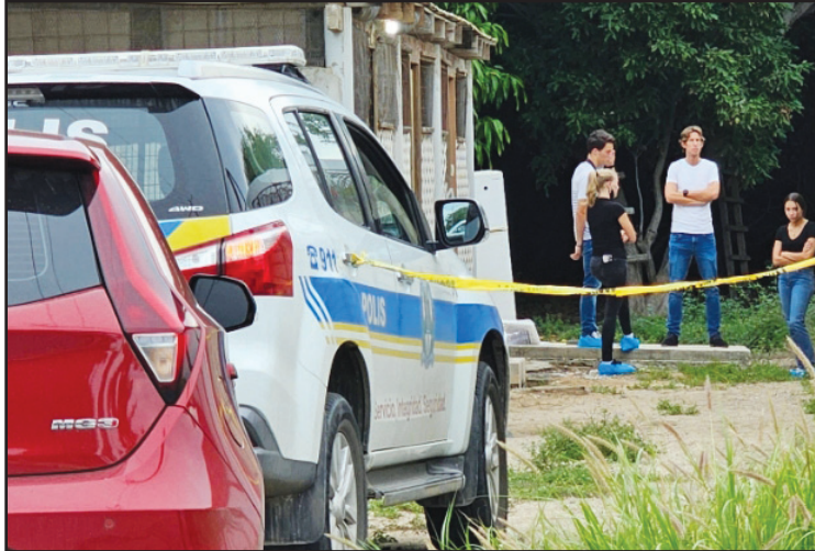
Avenida Milo Croes - Diamars den oranan di atardi e lint geel di polis por a wordo mira altura di mini market.

Un persona a bati alarma, momento cu e lo a bay bishita un conoci y lo a haya holor fuerte, cu tawata motibo suficiente pa avisa autoridad.